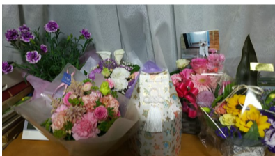
皆さんからいっぱいお花が届けられました。良かったね、すもも

あら？一万円なら送料無料！これってネット注文にはとても重要です。そうかママもいる。キキパパも14歳で病院通い、すももの兄弟のクロも心臓病を患っている。最近腎臓病まで併発している。爺婆犬、病弱犬、まとめて買えば送料無料で！瞬間数を入れるところに4個と入れそうになりましたが、よく生前にお墓を用意しておくと言きするって聞いてますし、どうしよう？ 今回は1個だけの注文にしましたが正直迷いました。