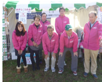
大藪保険は揃いのピンクでお出迎えます

すぎなみスイーツやパン祭り、さんまの塩焼き千名無料配布など食を満たし、ステージではウルトラマンショーや舞踊の演舞で目も楽しませてくれました。