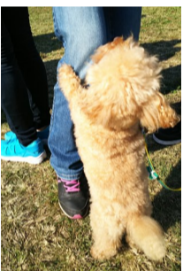
最後までママママ、後ろを振り返ってくれませんでした。ママが一番

なにしろ迷カメラマンですし、わんこはジューとしてくれません。特に大勢の人がいる場所では興奮、緊張していますから。