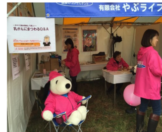
昨年のフェスタの様子です。

いつも事務所におります管理部長のスノーピー君も昨年も駆けつけてくれた「あんしんセイメイ」君も今年もお手伝いしてくれそうです。