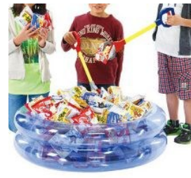
アマゾンからイメージです。

ママが乳がんセルフチェックをしている時に待っていてくださるお子様に今回は『お菓子のつかみ取り』を企画しました。