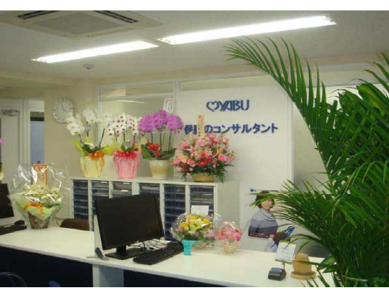
事務所の中はさらにお花と観葉植物がいっぱいです。うれしい悲鳴(;;) 来年咲かせることができるのか？！

3月23日から新事務所でスタートいたしましたこの事務所、なにせ前の事務所の二倍強、どこにしまつて、ファイルはどのキャビネットにいられたか？何回かは開けたり閉めたりを繰り返しましたが、やっとなんて広さにも保管場所もなれることができました。 仕事量はあまり変わりませんが大きく変わったのは新事務所祝いにいただいた観葉植物と胡蝶蘭のお手入れです。有り難いことに顧客の皆様をはじめ生損保の関係会社、仲良きささせていただいている代理店の仲間からです。胡蝶蘭の数はちょっとし銀座のクラブ？なにしろ観葉植物の鉢のほうが従業員より数が多い。水遣りも大変です。やっとなんてセキュリティも完備しました。おかげでドア